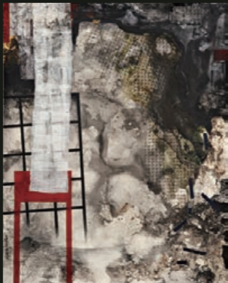
洪根深 人間風景 壓克力彩、墨、紙、咖啡渣、樹脂、畫布 162 x 130 cm 2010 荷軒新藝空間