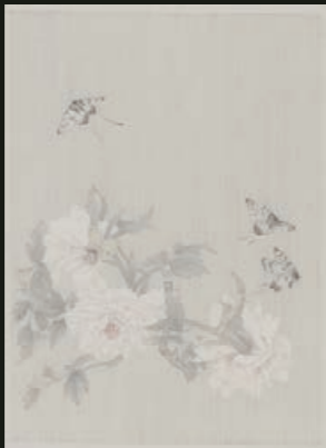
高茜 游仙窟之六 紙本設色 65 x 47 cm 2016 艾米李畫廊