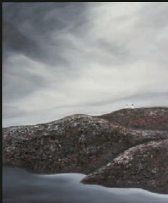
散子 清晨 布面油畫 120x100cm 2013 唯美藝術畫廊