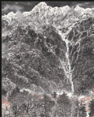
李小小 水墨山魂 設色紙本 250 x 203 cm 2016 言午畫廊

首屆「水墨現場」將與台北「無有設計」合作，史無前例地在展場中為觀眾呈獻「東方藝術X中國園林」的建築概念，結合水墨作品獨有的藝術性與當代建築美學。有別於一般藝術博覽會格式化的單點透視西式空間規劃，「水墨現場」展博會擷取蘇州名園「留園」的空間元素，呈現中式空間的曲折蜿蜒，以及模擬園林曲徑幽明的狀態，利用展場中的白牆、鋼件、薄紗，表達出中式空間的虛實、縮放與留白，回應中國園林的山水石樹。