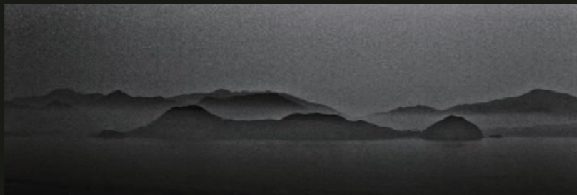
Cyril DELETTRE Untitled Inkjet Print on Fine Art Paper 34 x 84 cm La Galerie Paris 1839